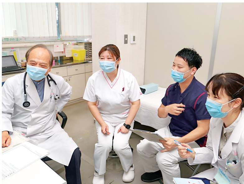
▲循環器医師が中心となり、患者の症状などの情報を共有。その後、それぞれの視点から療法案を出し合い、患者に合った療養指導を考えていく。