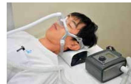
▲CPAPを装着。装置の作動音は静かだ。