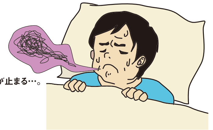
SAS=Sleep Apnea Syndrome : サス

大きなイビキをかいていたと思ったら、急に10秒以上呼吸が止まる…。そんな症状がある人は、睡眠時無呼吸症候群(SAS)を患っている可能性がある。放置すると大きな病気や事故につながる危険性があるため、イビキに覚えのある人は病院で検査をしてみよう。