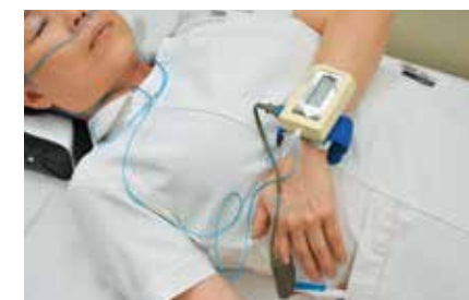
▲自宅での検査装置(パルスオキシメータ)。