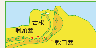
▲睡眠中は重力により軟口蓋や舌根、咽頭蓋が下がるため、気道が狭くなる。